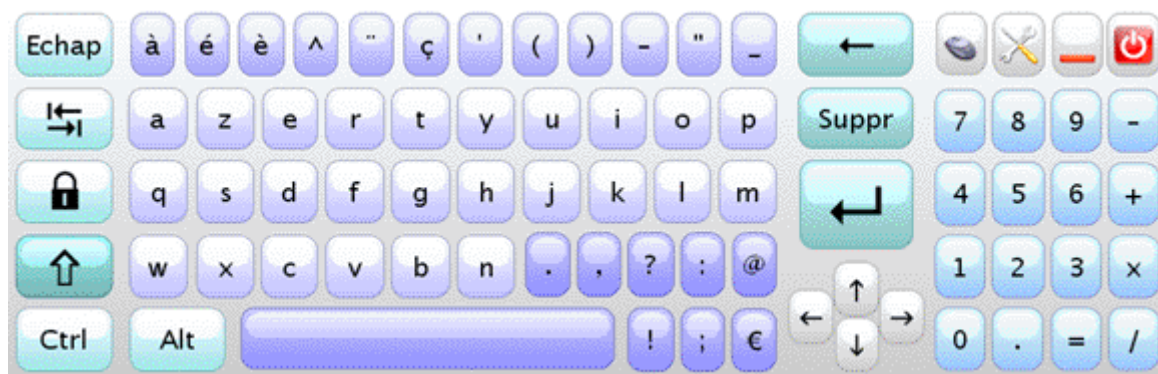
le clavicom NG, clavier standard

La prédiction de mots propose des mots à partir d'un dictionnaire (dans la langue souhaitée par l'utilisateur) et d'une liste de mots précédemment saisis par l'utilisateur.