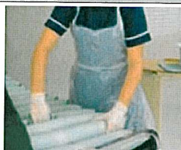
Facilité de nettoyage.

◀ POSITIONNER LA SOURIS SUR LES IMAGES POUR FAIRE DÉFILER LES CARACTÉRISTIQUES ▶