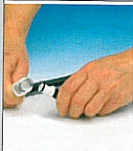
Mode transport autonomie de 1 heure environ.