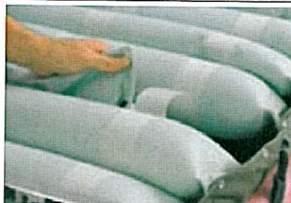
Cellules interchangeables pour une maintenance facilitée.