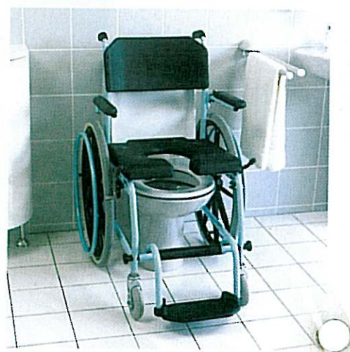
Le Delphin peut être amené au-dessus de toutes les toilettes conventionnelles.