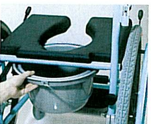
Plus d'indépendance grâce à un vase hygiénique intercalaire