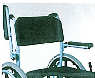
Ouverture sur tous les côtés