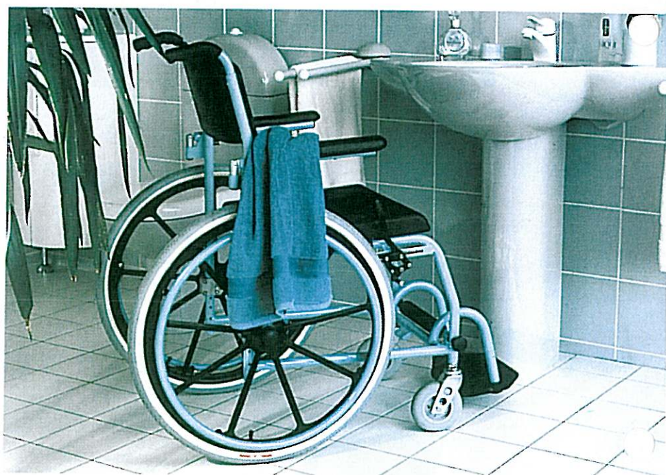
Trois fonctions : douche, toilettes et transport pour un seul fauteuil.