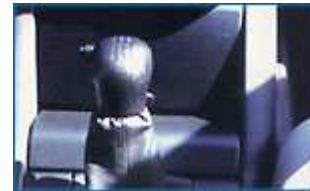
Bouton de débrayage

La commande automatique de la pédale d'embrayage, n'entraîne aucune modification sur le véhicule puisqu'elle s'adapte sur la pédale d'embrayage d'origine.. Le principe de fonctionnement de cet équipement est électropneumatique. La source d'énergie utilisée est la dépression.