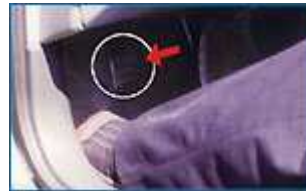
Positionnement du pied au repos