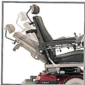
Réglage électrique du dossier