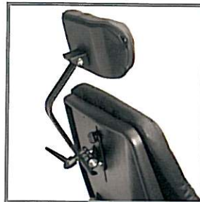
Appui-tête réglable en hauteur, profondeur et inclinaison