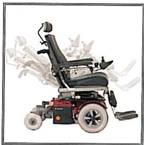
Inclinaison électrique de l'assise

La conception modulaire du siège Corpus constitue un gage de fonctionnalité accrue, notamment grâce aux dimensions d'assise modifiables et aux réglages électriques. Le Corpus a été conçu par l'un des ergonomes les plus réputés du monde. Le résultat ? Un siège qui épouse parfaitement la forme du corps. L'adaptabilité du siège Corpus est infinie. La profondeur, la largeur, la hauteur et l'inclinaison des différents éléments peuvent être réglées ou adaptées selon les besoins. L'ergonomie de l'assise et les réglages électriques en option font du Corpus le siège le plus apprécié du monde.