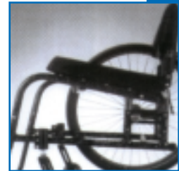
Longueur du châssis sur mesure