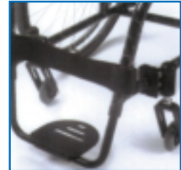
Palette plate-forme monobloc réglable en angle