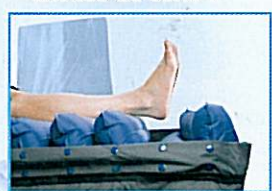
1 cellule de décharge talonnière