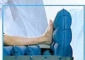
1 cellule antiéquin