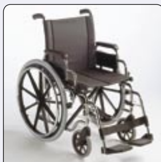
Version chromée Le chrome est moins sensible aux chocs quotidiens.