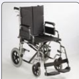
Version Transit Pour les transferts passifs.