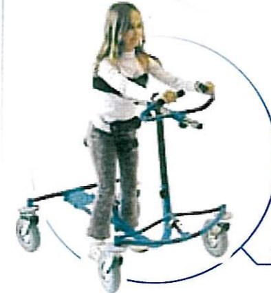
E4 Grande taille

EDUCATOR E3 est un appareil modulaire de verticalisation et de déambulation, conçu pour une utilisation en intérieur.