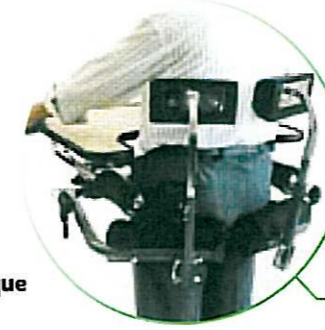
Appui dos inclinable (réglable hauteur, avant/arrière)