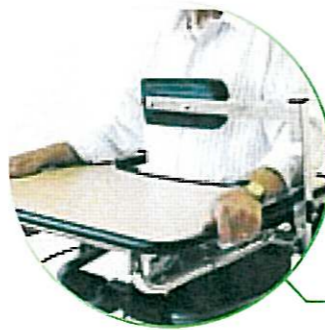
Appui frontal et thoracique (réglable en hauteur)

• Appui frontal et thoracique réglable en hauteur