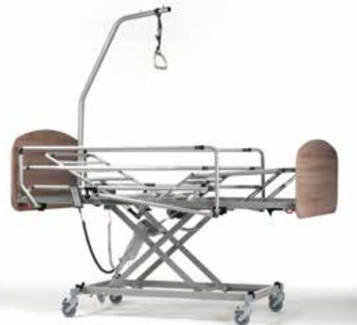
montage sans outils