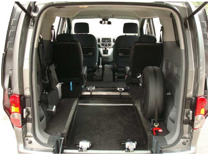
4 places assises + 1 en fauteuil roulant