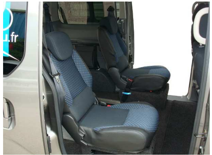
Sièges rabattables, repliables et démontables