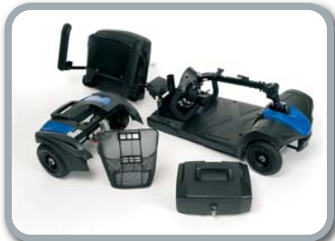
Démontage facile pour le transport