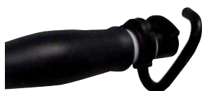
Crochets de sangle disponibles en option.

Avantages : Simplicité d'utilisation Multi-réglable Grande stabilité Design innovant