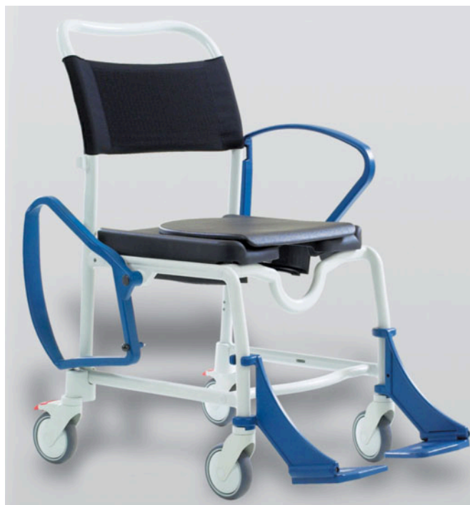
Photo : chaise réf. 5707.00