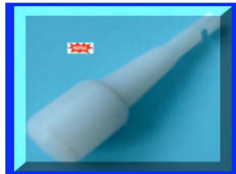
Embout tournant conique