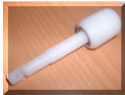
Embout sur roulement