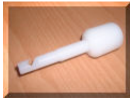
Embout rond fixe