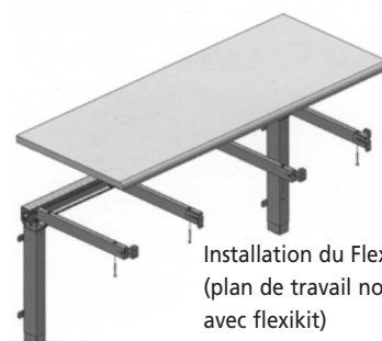
Installation du Flexikit (plan de travail non fourni avec flexikit)