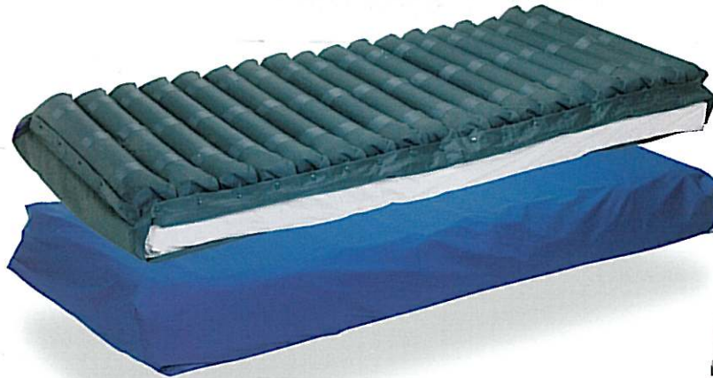
Réf. : 535 • Matelas Alizé.