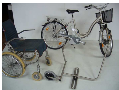
VAE JUBILEE avec VSC