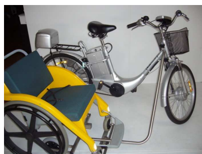
Montage sur VAE SPEEDY