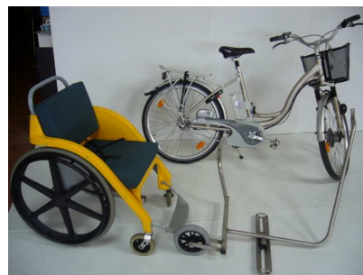
VAE JUBILEE avec VSC