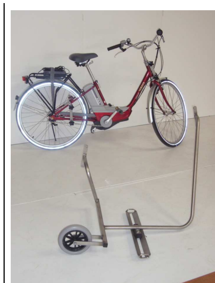
VAE YAMAHA et Vélo Side Chair démonté