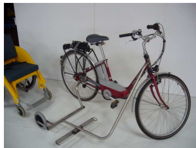
VAE YAMAHA et Vélo Side Chair monté