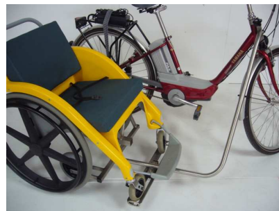
Ensemble Vélo Side Chair prêt à partir