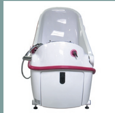
Trappe de maintenance