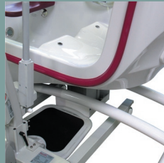
Accès par lève-personne