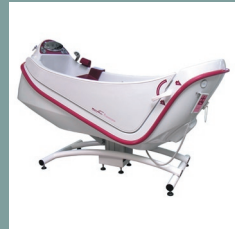
Inclinaison de cuve