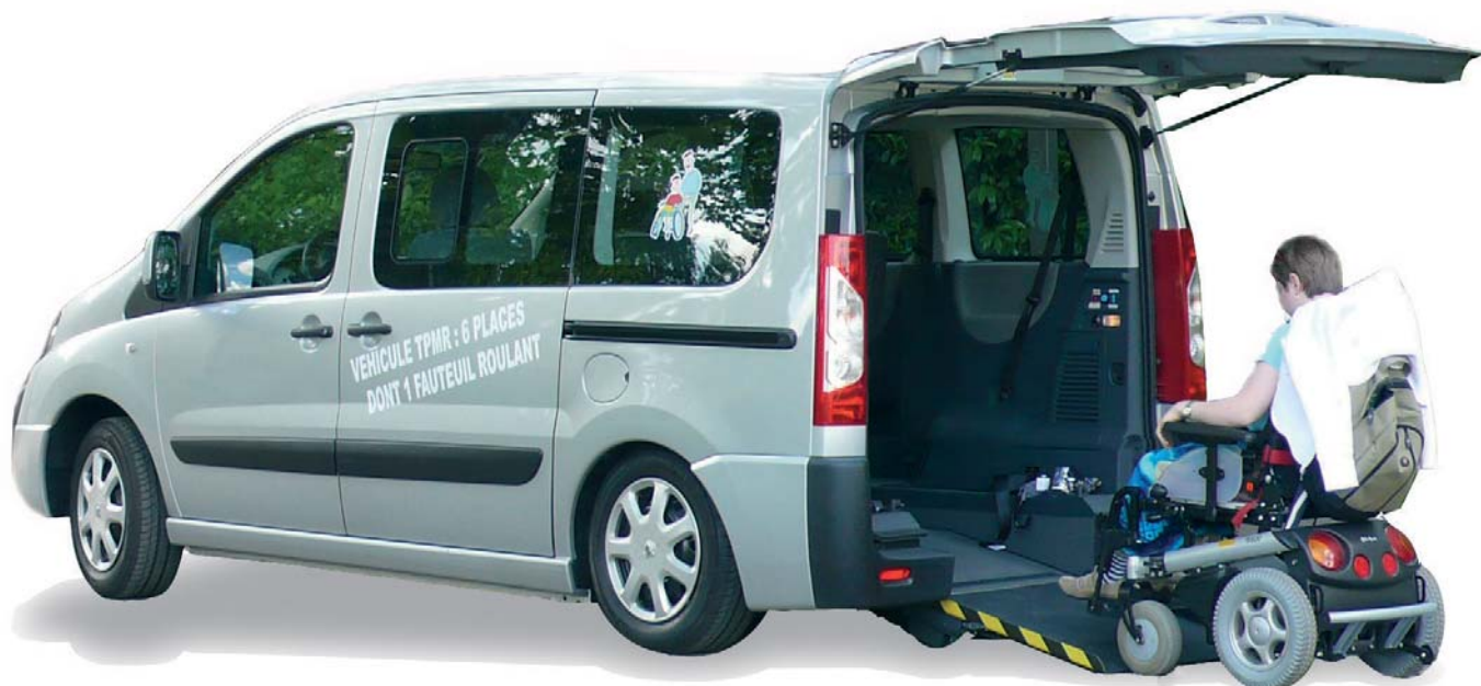
Version HACCESS PLUS