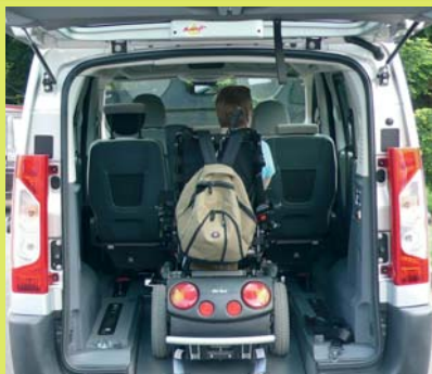
Véhicule spacieux faites de la route un espace de vie