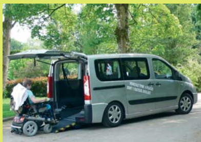
Version Haccess Plus : rampe manuelle courte et abaissement automatique du véhicule