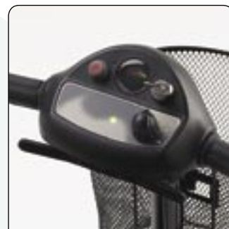
Tableau de bord simplifié

Batterie en prise sur le scooter ou chargement autonome.