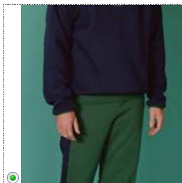
Pantalon Jean jacques