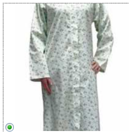
chemise de nuit Colette