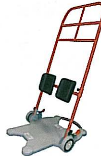
Ross ReTurn Light

Poignées en U (en option) pour offrir des choix de prises en mains multiples.