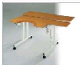
Table pour adultes hauteur de réglage de 56 à 84 pour le plateau clavier.

La distance entre plateau écran et plateau clavier est réglable sur 20 cm de manière à pouvoir éloigner ou rapprocher le plateau écran. Ainsi, la distance oeil-écran peut être personnalisée.