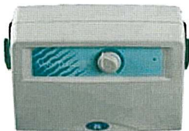
Pompe silencieuse, légère et peu encombrante