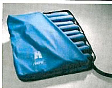
Housse amovible, lavable en machine