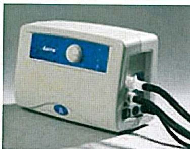
Sécurité: alarmes visuelles et sonores