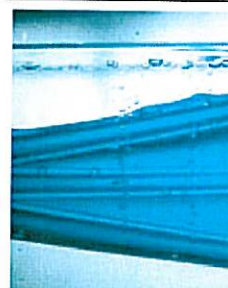
Micro perte d'air : ré-amélioration du support

◀ POSITIONNER LA SOURIS SUR LES IMAGES POUR FAIRE DÉFILER LES CARACTÉRISTIQUES ▶