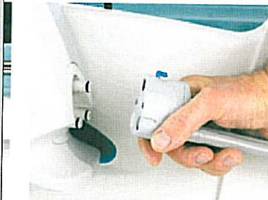
Mode transport : 12 heures environ.