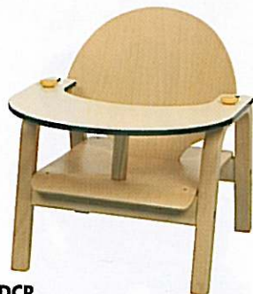
DCR Chaise repas Hauteur d'assise 18 cm. Hauteur de la tablette 32 cm.