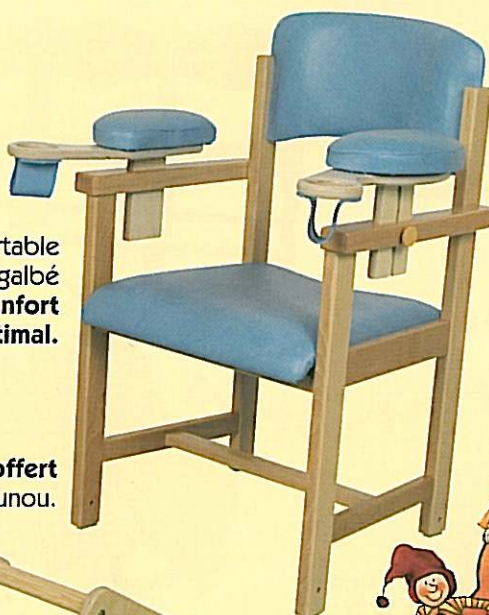
CNOU Chaise Nounou Couleur standard lavande

Le repose-pieds est offert avec chaque chaise Nounou.