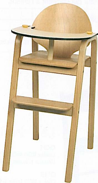
DCRH Chaise repas haute Hauteur d'assise 59 cm. Hauteur de la tablette 74 cm. Hauteur du repose-pieds : 40 cm

La tablette verrouillable pivote pour un accès direct à l'enfant.