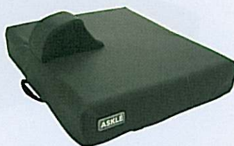
Coussin ALOVA avec butée pelvienne pour utilisateur avec troubles de la stabilité

Pour des utilisateurs à risque d'escarre :