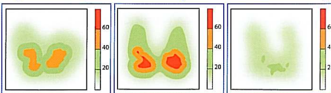
coussin en gel de polyuréthane