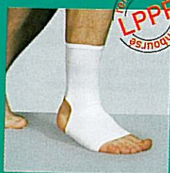
Chevillère GIBORTHO® V6 12