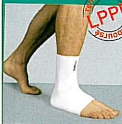
Chevillère GIBORTHO® V6 31