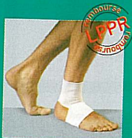
Chevillère GIBORTHO® V6 11