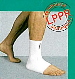
Chevillère GIBORTHO® V6 31