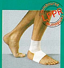
Chevillère GIBORTHO® V6 11