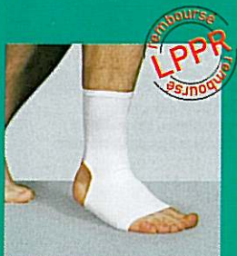
Chevillère GIBORTHO® V6 12