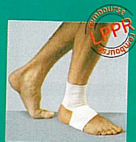
Chevillère GIBORTHO® V6 11