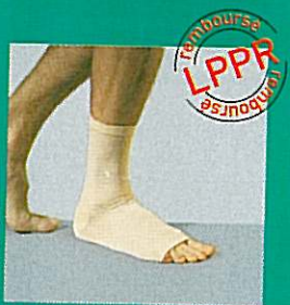
Chevillère GIBORTHO® V6 22