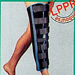
Attelle de genou GIBORTHO® "standard"