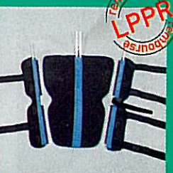
Attelle de genou GIBORTHO® "universelle"