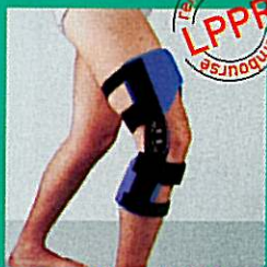
GENUGIB® POLY C