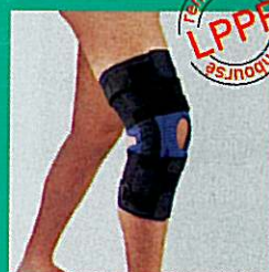
Orthèse de genou articulée GIBORTHO®