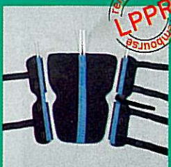
Attelle de genou GIBORTHO® "universelle"