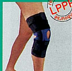
Orthèse de genou articulée GIBORTHO®