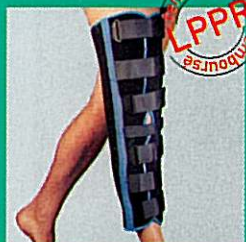
Attelle de genou GIBORTHO® "standard"