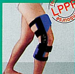
GENUGIB® POLY C