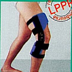
GENUGIB® POLY C