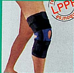
Orthèse de genou articulée GIBORTHO®