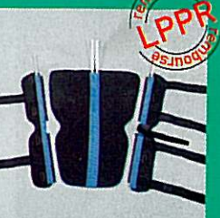
Attelle de genou GIBORTHO® "universelle"