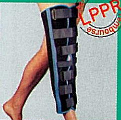
Attelle de genou GIBORTHO® "standard"