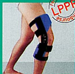
GENUGIB® POLY C