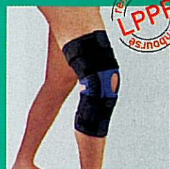
Orthèse de genou articulée GIBORTHO®