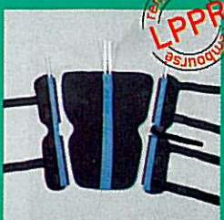
Attelle de genou GIBORTHO® "universelle"