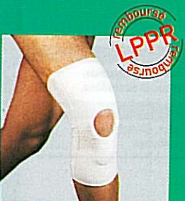
Genouillère GIBORTHO® rotulienne