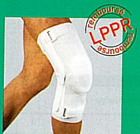
LIGAGIB® genouillère articulée