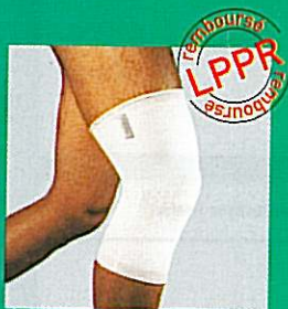
Genouillère GIBORTHO® V5 31