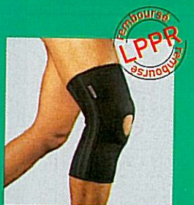
Genouillère GIBORTHO® ligamentaire