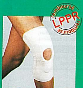
Genouillère GIBORTHO® rotulienne