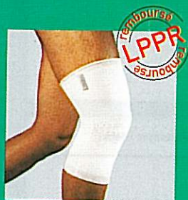
Genouillère GIBORTHO® V5 31