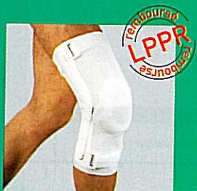
LIGAGIB® genouillère articulée