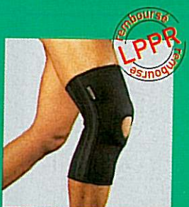
Genouillère GIBORTHO® ligamentaire