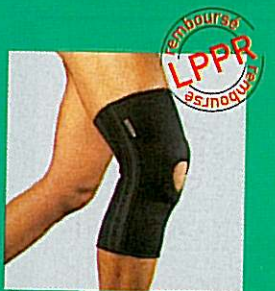
Genouillère GIBORTHO® ligamentaire