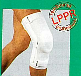
LIGAGIB® genouillère articulée