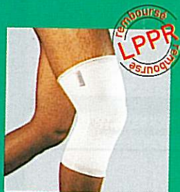
Genouillère GIBORTHO® V5 31