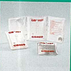
GIB'HOT® thermoactive et maxi GIB'HOT® thermoactive