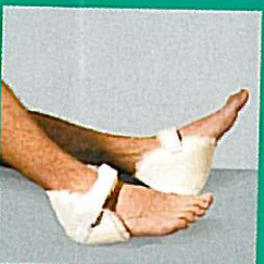
Talonniers de protection GIBAUD®