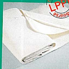
Alaise imperméable GIBORTHO®