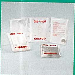
GIB'HOT® thermoactive et maxi GIB'HOT® thermoactive