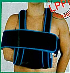
Gilet de série GIBORTHO® (blocage d'épaule)