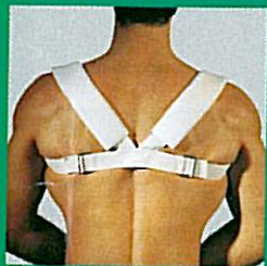
Blocage claviculaire GIBAUD®