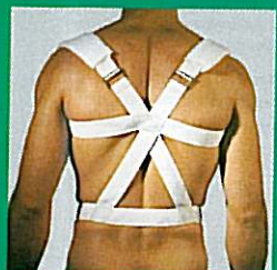
Redresse dos GIBAUD®