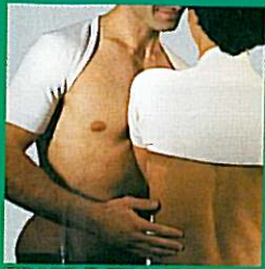
EPAULCHAUD® thermique GIBAUD®