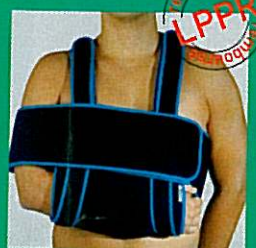
Gilet de série GIBORTHO® (blocage d'épaule)