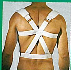
Redresse dos GIBAUD®