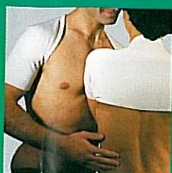
EPAULCHAUD® thermique GIBAUD®