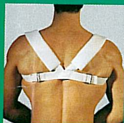
Blocage claviculaire GIBAUD®