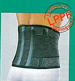
C.S.L. GIBORTHO® double serrage