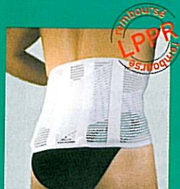
LOMBOGIB® action V

Prise de mesure : tour de taille ou de hanches en cm