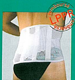
LOMBOGIB® action V

Prise de mesure : tour de taille ou de hanches en cm