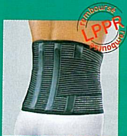
C.S.L. GIBORTHO® double serrage