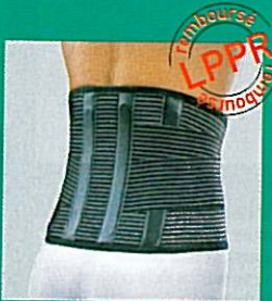
C.S.L. GIBORTHO® double serrage