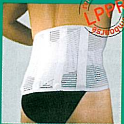
LOMBOGIB® action V

Prise de mesure : tour de taille ou de hanches en cm