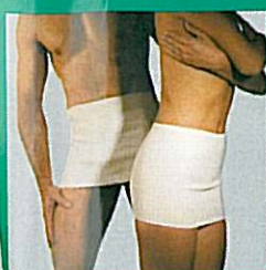
Ceintures thermiques GIBAUD®