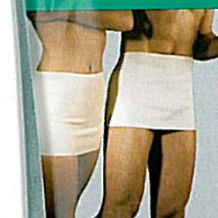
Ceintures thermiques GIBAUD®