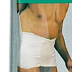
Ceinture de maintien réglable GIBAUD®