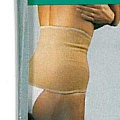
Ceinture thermoactive GIB'HOT®