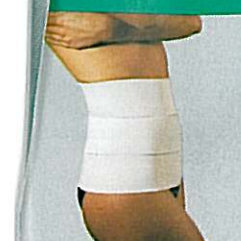
Ceinture abdominale élastique GIBAUD®